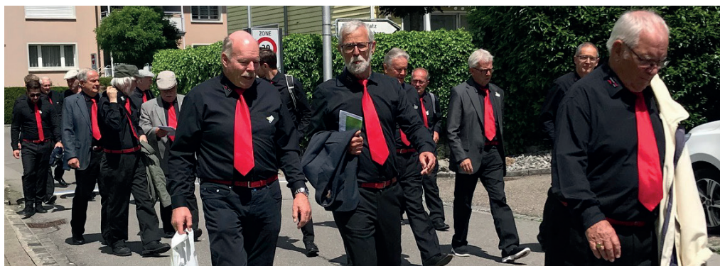
Mit grosser Vorfreude auf dem Weg zum Konzert vor den Experten.