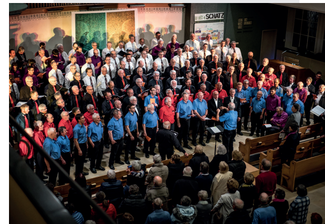
Am 1. Männerstimmenfestival «Mann singt.» 2018

Probe: Jeweils am Montag, 19.45 bis 21.30 Uhr im Schulhaus Dorf, Heiden