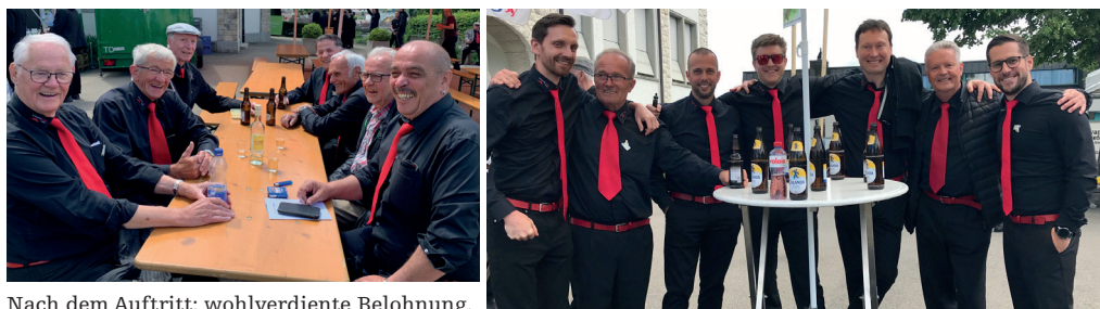
Nach dem Auftritt: wohlverdiente Belohnung.